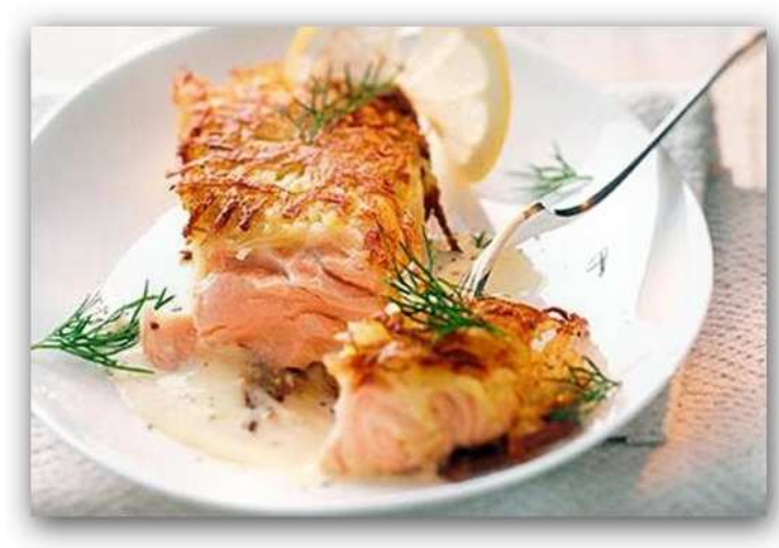
Lachs in der Kartoffelkruste